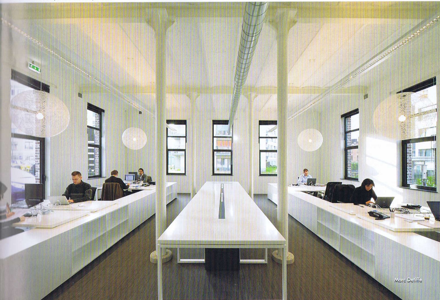
Paardenstoeterij van de Koninklijke Jacht

"Onze benadering van projecten is toch enigszins anders dan die van 'monumentalist' als Santiago Calatrava (Spaanse toparchitect, nvdr) of Frank Gehri (USA). Bij Assar is de 'monumentale' opbouw het gevolg van het respecteren van het programma, het budget en de afgesproken termijn met de klant. Het monumentale karakter is niet ons hoofddoel van een project. Niet dat wij de 'monumentale' architectuur minachten, integendeel, maar het is niet het domein waarin we ons al die jaren hebben kunnen onderscheiden. De ganse wereld kan zich toch niet toespitsen op het ontwerp van de nieuwste Ferrari of Maserati?! Dat is een andere discipline, bestemd voor een heel select publiek. Wij halen evenveel voldoening uit het ontwikkelen van meer klassieke programma's, zoals ook de ontwerpers van Audi, BMW of Fiat doen."